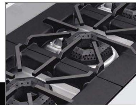
Robustas parrillas súper resistentes y desmontables para facilitar la limpieza.