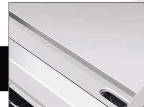
Plancha con exclusivo sistema recolector de grasa y residuos.