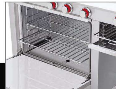
Horno mucho más productivo. ¡Puede hornear de todo! Pan, pasteles, aves, pescados, carnes, pasta, etc.