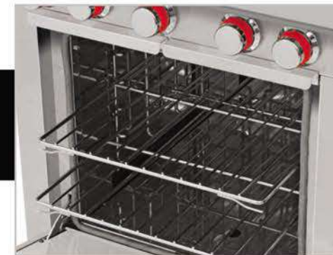
Horno mucho más productivo. ¡Puede hornear de todo! Pan, pasteles, aves, pescados, carnes, pasta, etc.