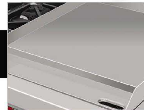
Plancha con exclusivo sistema recolector de grasa y residuos.