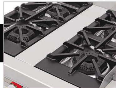
Robustas parrillas súper resistentes desmontables.