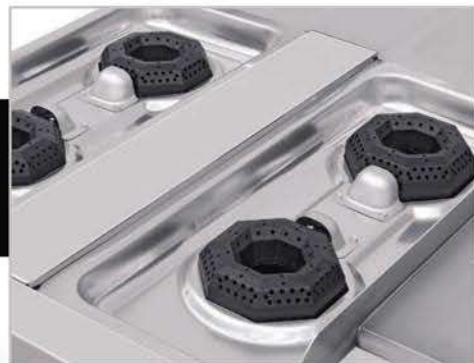
Cubierta semi-sellada evita derrames al interior.