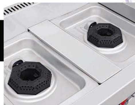
Cubierta semi-sellada para evitar derrame al interior.