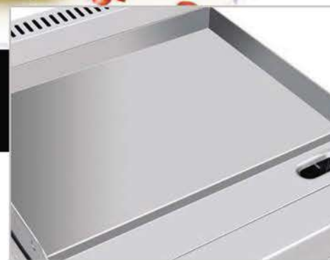
Plancha con exclusivo sistema recolector de grasa y residuos.