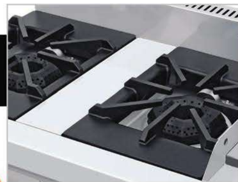
Robustas parrillas súper resistentes desmontables.