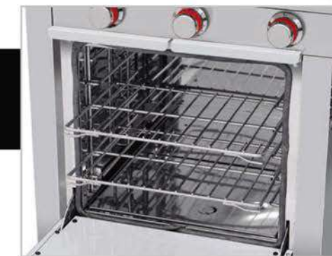
Horno mucho más productivo. ¡Puede hornear de todo! Pan, pasteles, aves, pescados, carnes, pasta, etc.