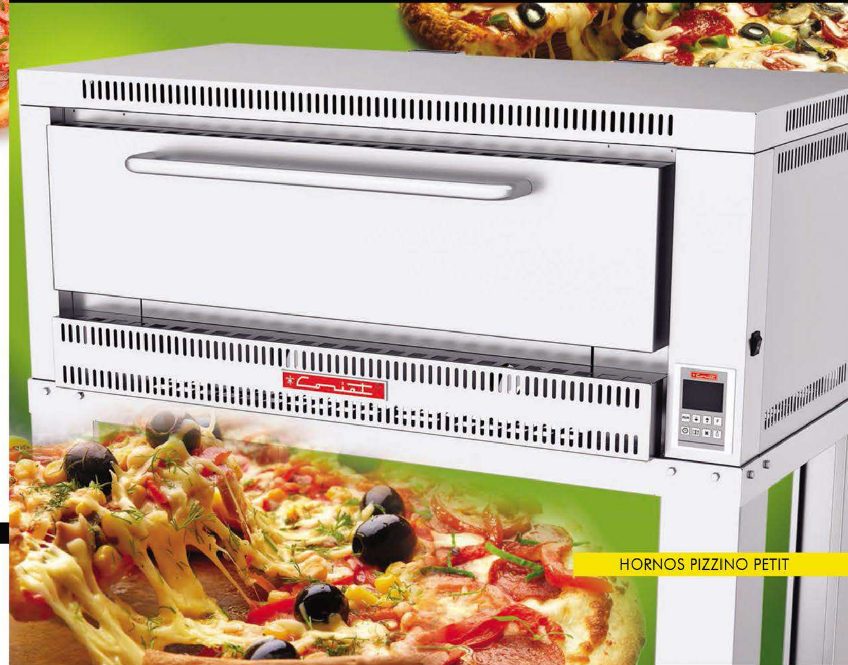
HORNOS PIZZINO PETIT