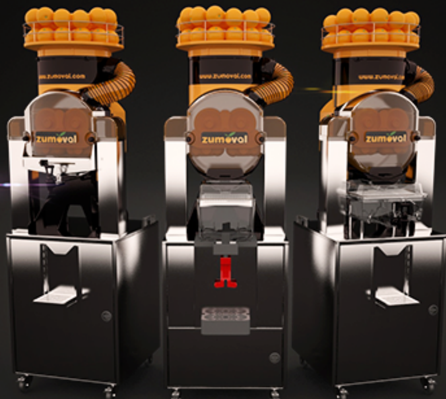
Mueble self service