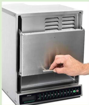
Cierre la puerta y active la tecla de control con un solo movimiento