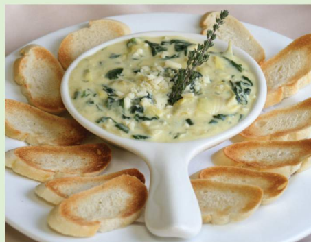
La salsa con espinaca congelada se calienta en 1:30