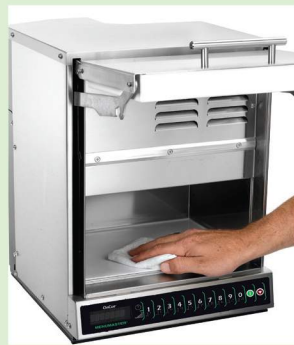
Se limpia fácilmente con paños húmedos descartables