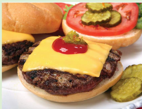
La hamburguesa con queso se calienta en 4 segundos