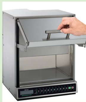
La puerta se extiende para permitir una limpieza fácil y rápida de la cavidad