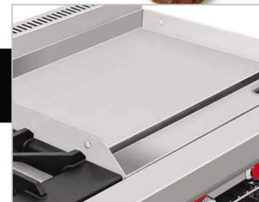
Plancha con exclusivo sistema recolector de grasa y residuos.

Disponible en tres diferentes versiones: