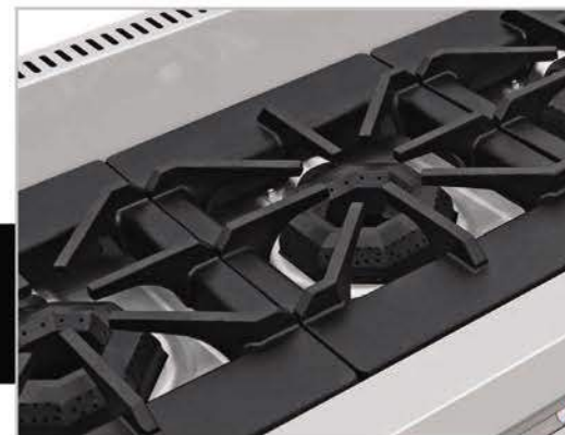
Robustas parrillas súper resistentes desmontables.