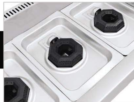
Cubierta semi-sellada que evita derrames al interior.