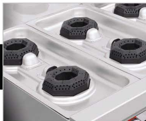
Cubierta semi-sellada, evita escurrimientos al interior.