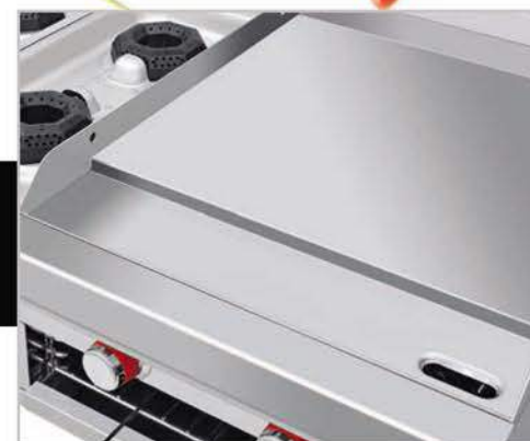
Plancha con exclusivo sistema para recolectar grasa y residuos.