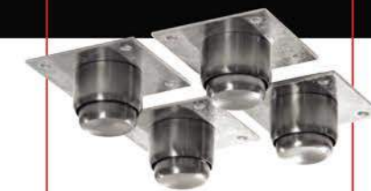
OPCIONAL: Base estructural o Kit de patas tubulares.