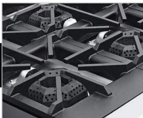
Robustas parrillas súper resistentes desmontables, facilitan la limpieza.