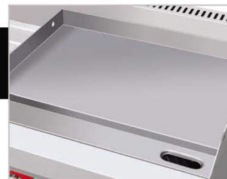
Plancha con exclusivo sistema recolector de grasa y residuos.