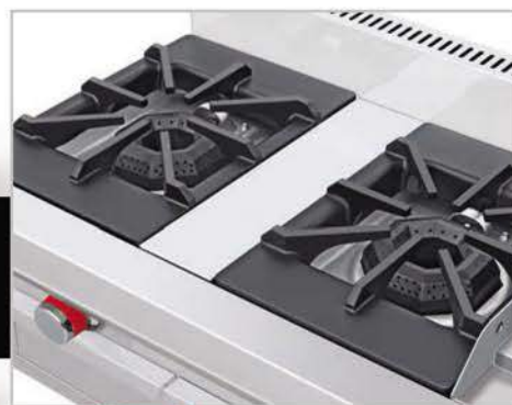
Robustas parrillas súper resistentes desmontables.