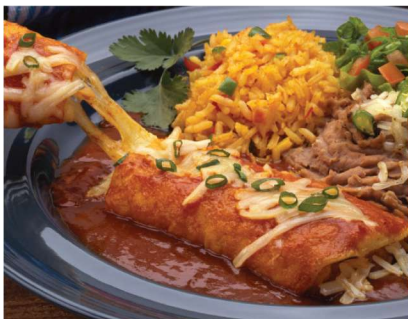
Una fuente de comida mexicana se calienta en 30 segundos

Los selectores de nivel de potencia del teclado incluyen 20 % de potencia (Descongelar), 50 % de potencia, 70 % de potencia y 100 % de potencia