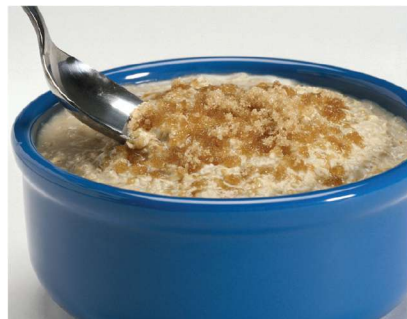
La cocción por etapas prepara perfectamente avena instantánea en 2 minutos